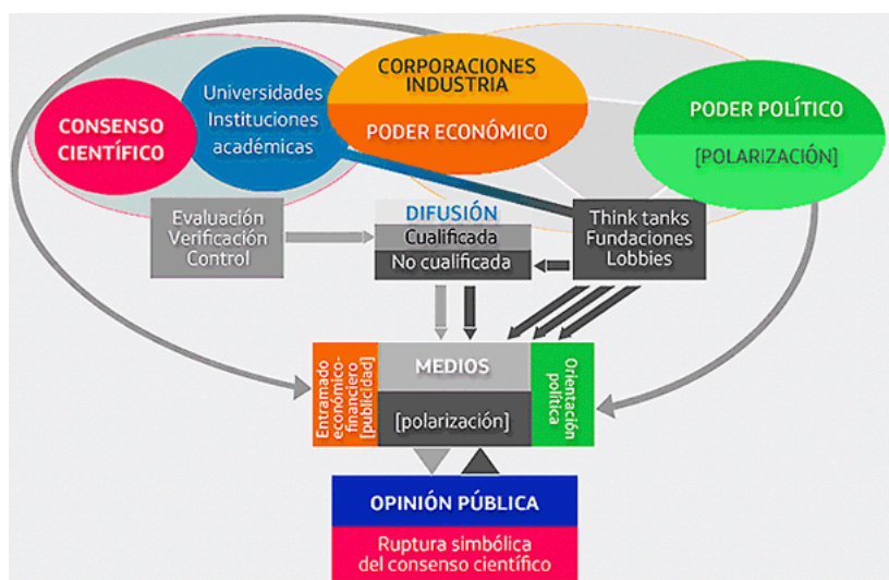
Figura. 1 Esquema sobre la ruptura simbólica del consenso científico en el proceso de relaciones de poder que conducen a la mediación y a la creación de opinión pública. Hecho a partir del análisis de la situación en Estados Unidos (Díaz-Nosty, 2012).

Ante una cuestión central, se ponen de manifiesto algunas de las contradicciones que hablan de la crisis del paradigma vigente. Y gran parte de estas contradicciones son fruto de un choque dialéctico entre las promesas de transparencia, descritas en los mitos fundacionales de la sociedad de la información, con las prácticas restrictivas que se dibujan en un panorama de opacidad, desinformación, propaganda, pérdida de credibilidad y distintas formas de corrupción.