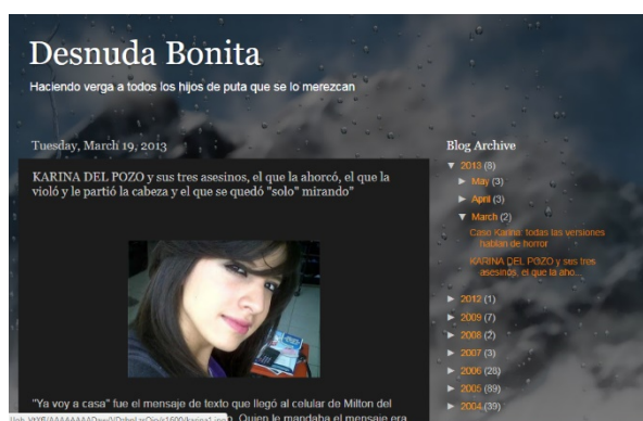
Figura 5. Desnuda Bonita.

Fuente: (Blog “Desnuda bonita” marzo 2013).