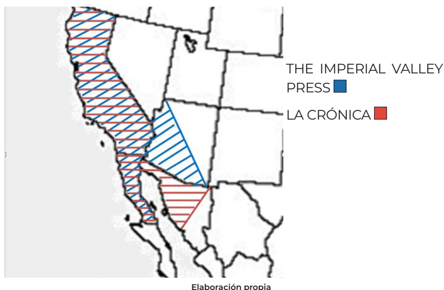
Gráfico 1 Cobertura Comparada