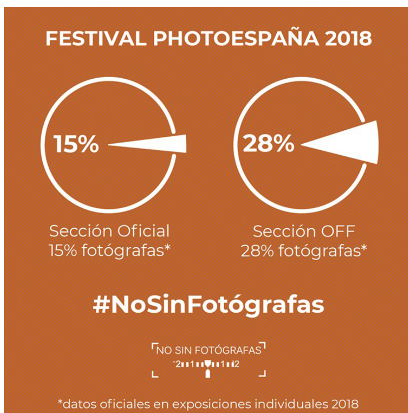
Figura 3: Gráfica creada por #NoSinFotógrafas para denunciar el porcentaje de presencia femenina en el Festival PhotoEspaña 2018