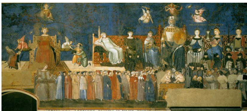
Figura 1. Alegoría del Buen Gobierno, Ambrogio Lorenzetti

Es un cuadro de una mujer [Figura 1] que se supone representa la paz. Ella podría ser una de las jóvenes liberadas o que quieren liberarse hoy en día. Está cómoda, relajada, no está interpretando ningún papel, es capaz de combinar el placer con el pensamiento y con soñar y podría saltar a la acción en cualquier momento. Y para mí ella tiene mucho más que ver con la desnudez, con uno mismo, con la verdad sobre uno mismo, que los otros desnudos que he visto". (s.f.).