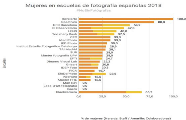
Figura 4: Gráfico elaborado por #NoSinFotógrafas que muestra el porcentaje de mujeres en las escuelas de fotografía españolas.