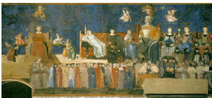
Figura 1. Alegoría del Buen Gobierno. Ambrogio Lorenzetti.

Que la representación del género femenino en la historia del arte ha estado "en manos de hombres" (Pérez Gauli, 2000) no es algo nuevo,