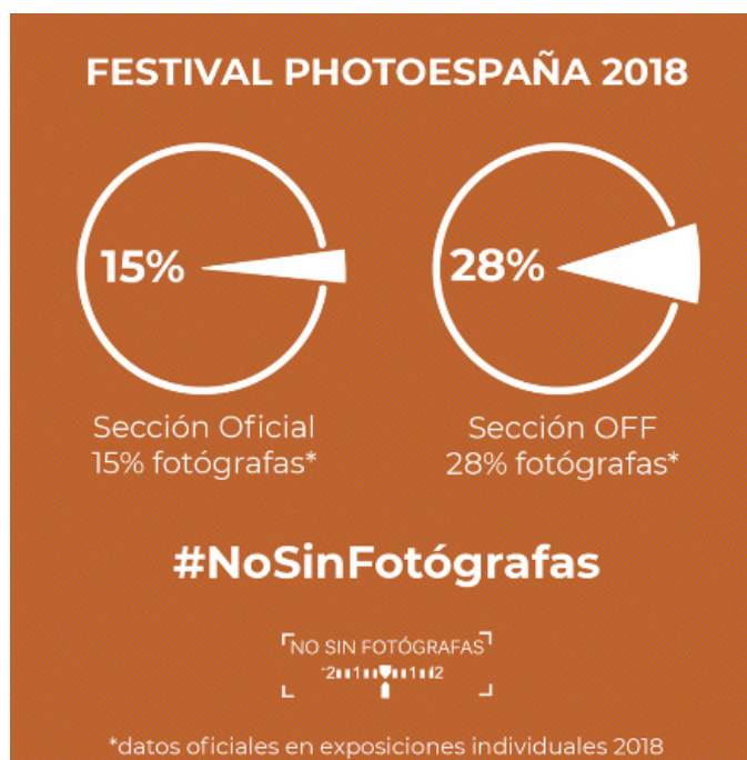
Figura 3: Gráfica creada por #NoSinFotógrafas para denunciar el porcentaje de presencia femenina en el Festival PhotoEspaña 2018