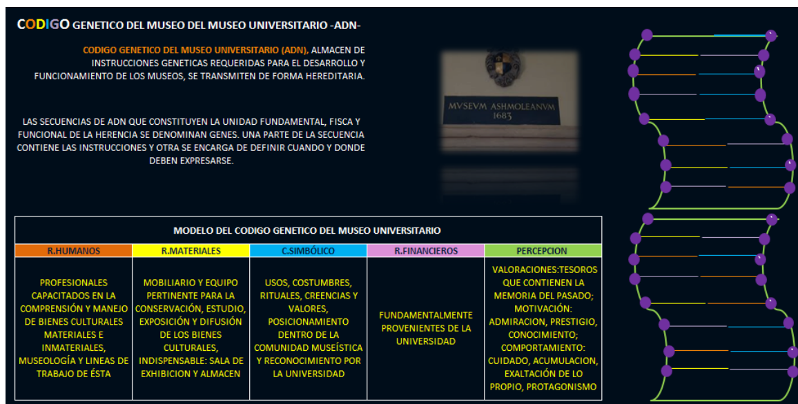
Tabla 7 ¿Qué hace un museo universitario? BRA