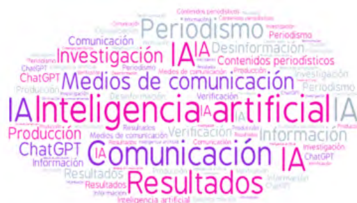
Figura 2: Word cloud de los tópicos destacados

Para llevar a cabo este procedimiento, en primer lugar, se identificaron los principales conceptos relacionados con IA y Comunicación. Para ello, se incluyeron todos los títulos y resúmenes de los 54 artículos en la herramienta WordCounter para detectar la moda de los términos. Las palabras más repetidas se detallan a continuación: inteligencia artificial (107), comunicación (69), contenidos periodísticos (65), medios de comunicación (55), resultados (46), periodismo (44), verificación (35), investigación (31), desinformación (27), producción (23), información (22) y ChatGPT (20) (Figura 2).