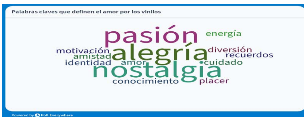
Figura 2. Palabras claves sentimiento del skinhead por el vinilo

La nueva generación de compradores de vinilos son clientes serios, dedicados y valiosos, al igual que sus predecesores. Y al igual que la generación anterior, estos compradores quieren más; más productos de los artistas que apoyan o de los géneros que están explorando y mejores equipos para escuchar. (Crupnick, 2022)