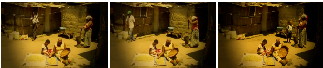
Figura 2– Aprendizado e vivência com as matriarcas.

Também é com as anciãs que Phatyma aprende sobre o que é ser “homem” e o que é ser “mulher”. Tal sequência, pela cor amarelada e a ausência de trilha sonora, contrasta com o caráter festivo das cenas iniciais de seu nascimento. A personagem aparece junto à mãe e à avó, que fazem serviços domésticos. Elas permanecem ali, enquanto marido e filhos saem, vão trabalhar e estudar fora (Figura 2), pois como afirma a protagonista “a mim foi ensinado que tenho que ficar em casa”.