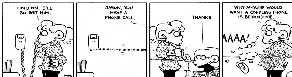
Figura 2: Tira em quadrinhos Foxtrot.

a descontração e informalidade estilística que são mais coerentes com este tipo de linguagem (GUIGAR et. al., 2011).