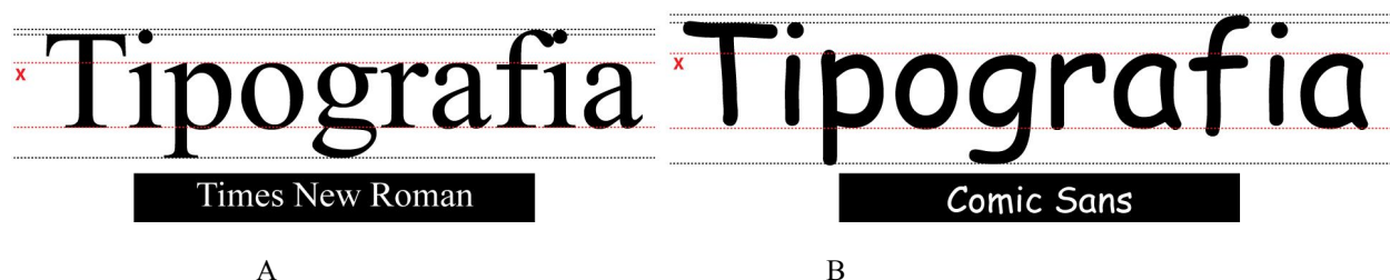
Figura 3: (A) Fonte Times New Roman e (B) Fonte Comic Sans .

Adotando a perspectiva tradicional em Design Gráfico, Rocha (2012, p. 44) considera que, tecnicamente, a qualidade de uma fonte é definida pela legibilidade e pela harmonia na composição das palavras e textos. Sob essa perspectiva é interessante comparar a fonte Comic Sans com as fontes Times New Roman e Gosmick Sans.