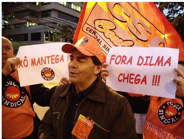
Figura 8: Cartazes em manifestação popular em julho de 2013.

No Brasil, o ano de 2013 foi emblemático com relação ao uso indiscriminado da fonte tipográfica Comic Sans. Isso é evidenciado nas imagens das manifestações populares ocorridas no mês de julho (Fig. 8), em que a fonte foi aplicada nos cartazes de protesto. Entretanto, apesar de reforçar o caráter popular das manifestações, essa aplicação propicia um sentido de descontração que é inadequado à gravidade dos temas sociais e políticos.