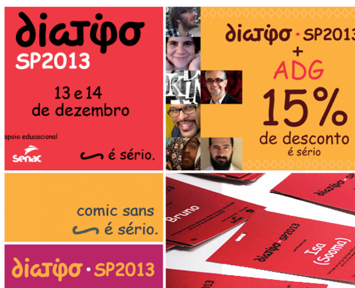
Figura 5: A aplicação da fonte Comic Sans na divulgação gráfica do evento Diatipo 2013.