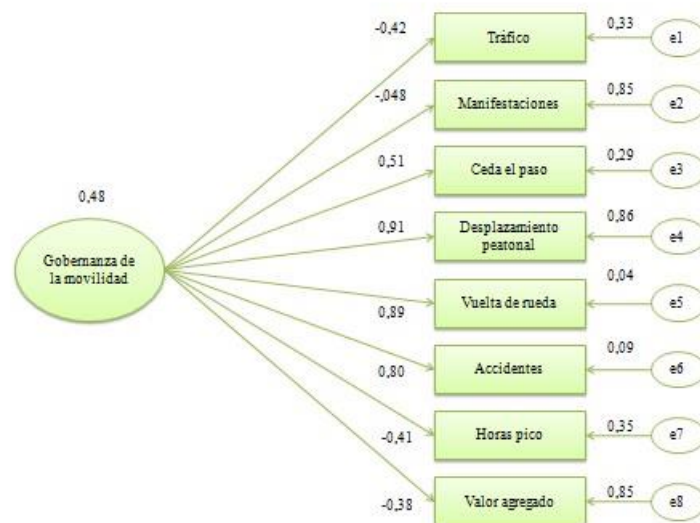
Figura 3. Modelo estructural

Respecto a la gobernanza de la movilidad el modelo estructural reflejante advierte que el desplazamiento peatonal es su indicador principal (0,91) seguido del desplazamiento a vuelta de rueda (0,89) y los accidentes (0,80). Incluye la cortesía de ceder el paso (0,51) y las manifestaciones (-0,48), aunque el tráfico (0,42), horas pico (0,41) y valor agregado (0,38) complementan la complejidad del sistema sociopolítico del Estado de México. Es decir, las dimensiones complejas de la movilidad periurbana están indicadas por ocho dimensiones derivadas de la complejidad sociopolítica en cuanto la construcción de acuerdos por vía de la discusión y el debate público, empero tales indicadores son opuestos ya que por una parte la cortesía de ceder el paso supone la emergencia de una ciudadanía vial, los accidentes y manifestaciones apoyan la hipótesis de contradicción. En este sentido, llama la atención que la movilidad periurbana sea considerada como una oportunidad de comunicación ya que buena parte de sus usuarios se entretienen con dispositivos electrónicos (véase figura 3).