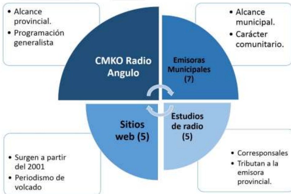
Gráfico 1: Grupo mediático CMKO Radio Angulo.