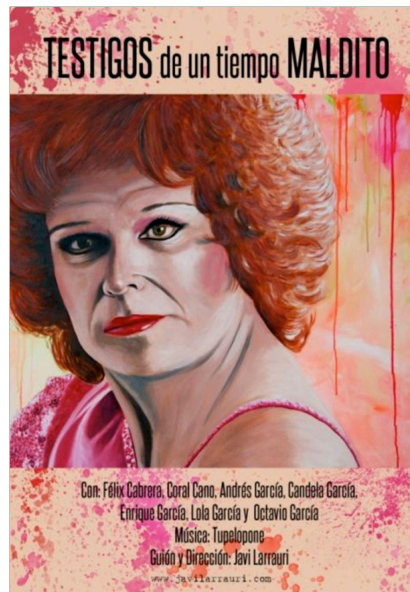
Cartel Testigos de un tiempo maldito