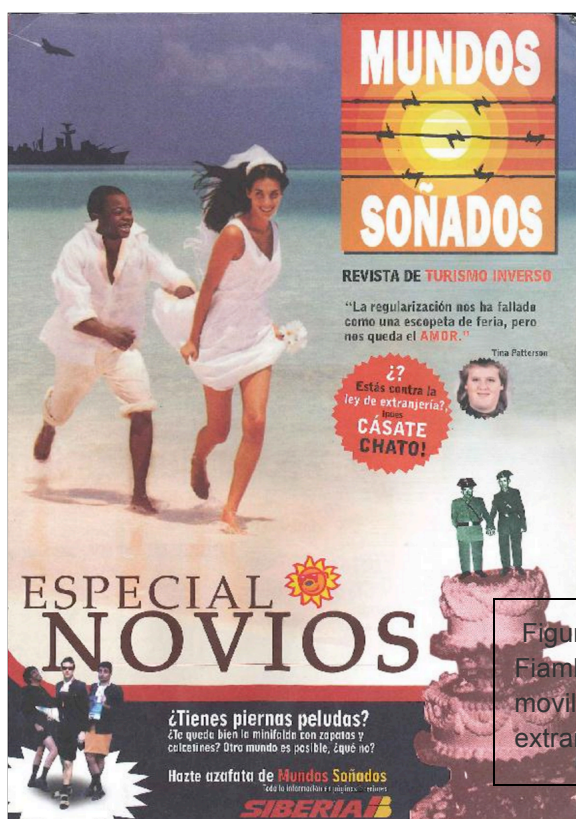
Figura 7: Revista que el colectivo La Fiambrera obrera repartió en 2006 para movilizar a la ciudadanía contra la ley de extranjería.

¿Estás contra la ley de extranjería? ¡Pues cástate chato! En este número exploraremos viajes a los márgenes de la ley de extranjería, esa bestia legal en que vivimos. Viaja con nosotros y descubre cómo desobedecer y sabotear una ley que priva de derechos civiles a tus vecinos y te hace cómplice de la precariedad en la que se les obliga a vivir.