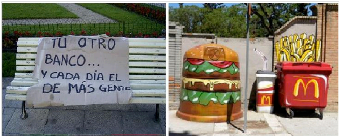
Figura 4: Contrapublicidad sobre ING. Figura 5: Contrapublicidad sobre McDonalds.

Pero desconectemos por un momento la TV y salgamos a la calle para observarla y pensarla como espacio para la negociación de nuestra vida cotidiana y de sus conflictos y no sólo como espacio del anonimato y de tráfico comercial. Quizás podamos cruzarnos con las intervenciones de las Figuras 4 y 5.