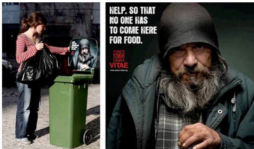
Figura 2: Campaña de VITAE contra el hambre.

Más bien, este tipo de campañas de comunicación plantean el problema del hambre, por seguir este ejemplo, como competencia exclusiva de las ONGD y sus técnicos, centrando sus estrategias de persuasión en los comportamientos individuales, el espectáculo y las emociones paralizantes. Tal podría ser el caso de la campaña de publicidad de guerrilla de la Figura 2.