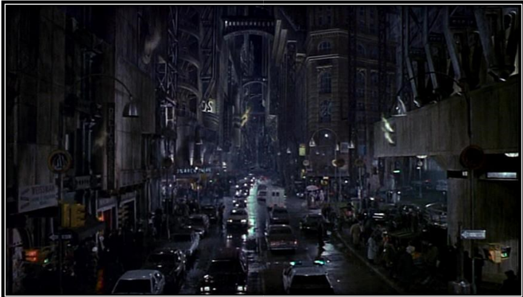
FIGURA 1 – A arquitetura esmagadora da Gotham City de Tim Burton.

O plano seguinte reforça a verticalidade. Conforme é visível na figura abaixo, trata-se de um cenário soturno de decadência urbana, com trânsito congestionado e aglomeração de pessoas. As construções altas e robustas que emolduram o ambiente mesclam construções de alvenaria de talhe pesado, arcobotantes, estruturas de aço, pontes elevadas e tubulações expostas. A composição é grandiosa e decrépita ao mesmo tempo, exibindo uma arquitetura portentosa, mas deteriorada, vítima de depredação ou negligência.