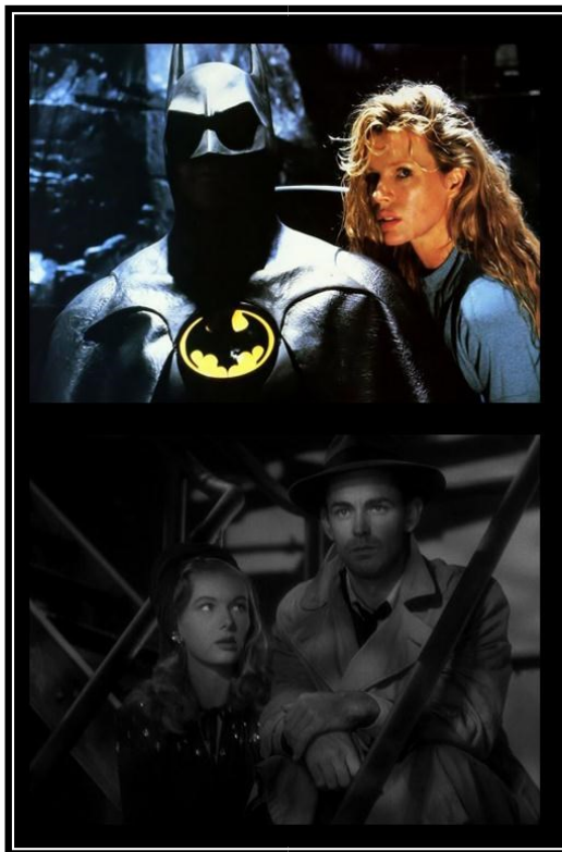
FIGURA 4 – Usos da iluminação em Batman (em cima) e no noir Alma Torturada de Frank Tuttle (1942)

À maneira empregada pelos cinemas noir e expressionista, vemos em Batman um uso dramático do contraste entre luz e sombra, efetivamente amplificando as propriedades expressivas da imagem. No caso de Batman , além de auxiliar a produzir a atmosfera sombria que permeia toda a narrativa, vemos que a iluminação reforça ao personagem sua silhueta icônica, subtraindo-lhe os caracteres mais nitidamente humanos: os olhos e a parte do rosto que a máscara não oculta. Deste modo, o personagem adquire uma aparência mais misteriosa e soturna – o que também pode ser visualizado tanto no início do filme quanto em seu epílogo.