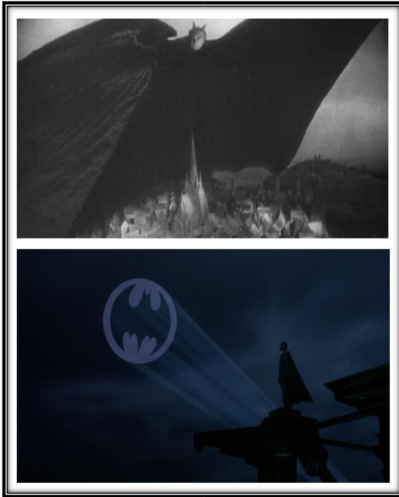
FIGURA 3 – Mefistófeles acima da cidade em Fausto (acima) e Batman acima da cidade (abaixo)