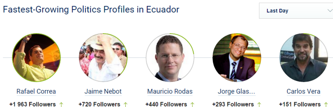
Gráfico N° 1 Crecimiento de figuras políticas en Ecuador

Según el portal Freedom House ( https://freedomhouse.org/report/freedom-net/2014/ecuador ) en Ecuador existe un aproximado de 2.500.000 usuarios en Twitter hasta mayo de 2014. Este mismo portal cita los políticos con mayor crecimiento en redes en Ecuador. Hasta el 19 de febrero de 2015 los cinco más populares en la Red son Rafael Correa (Presidente del Ecuador) con un avance de +1963 seguidores. Le sigue Jaime Nebot (Alcalde de Guayaquil y opositor a Correa) con +720. Posteriormente Mauricio Rodas (Alcalde de Quito y candidato a presidente en 2013) con +440. Luego Jorge Glass (Vicepresidente del Ecuador) con +293 y Carlos Vera (expresentador de televisión y activista político) con 151 seguidores (SocialBakers, 2015).